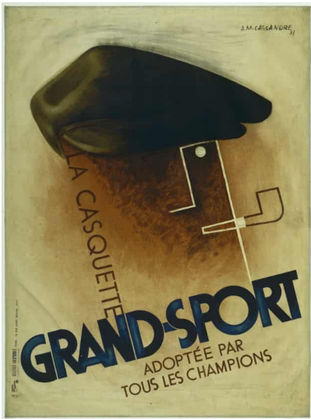
Litografía de 1931, actualmente en el MOMA de N. York