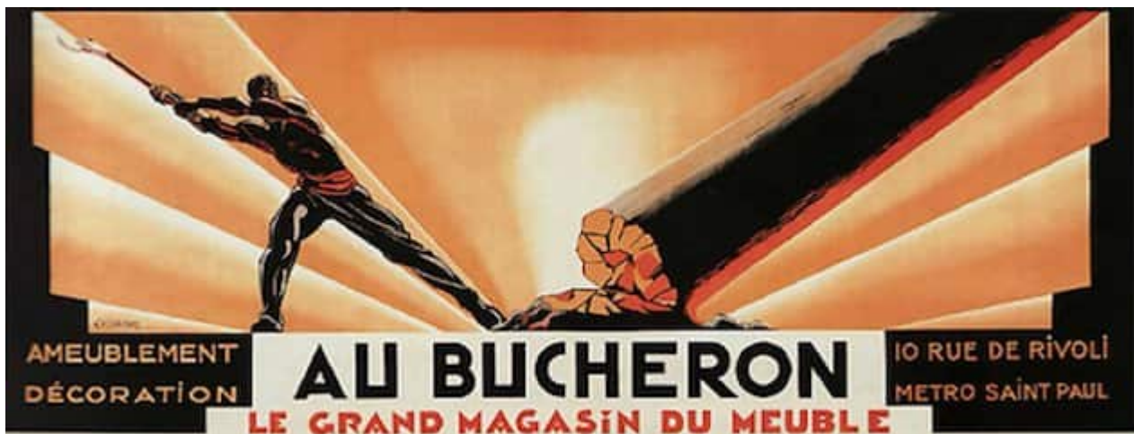
Cartel «Au Bucheron» (leñador)

En 1923 realiza para una tienda de muebles el cartel Au Bucheron que firma con el seudónimo de «Cassandre» y comienza a forjarse su carrera profesional. Este cartel ganó un premio en la Exposición de Artes Decorativas en 1925.