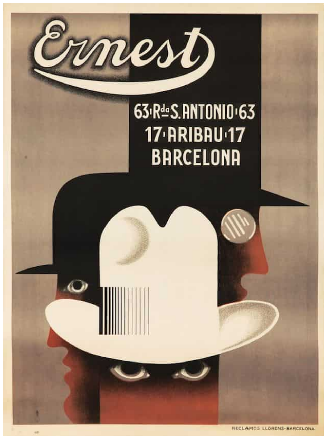
Cartel para la sombrerería barcelonesa Ernest (1926)