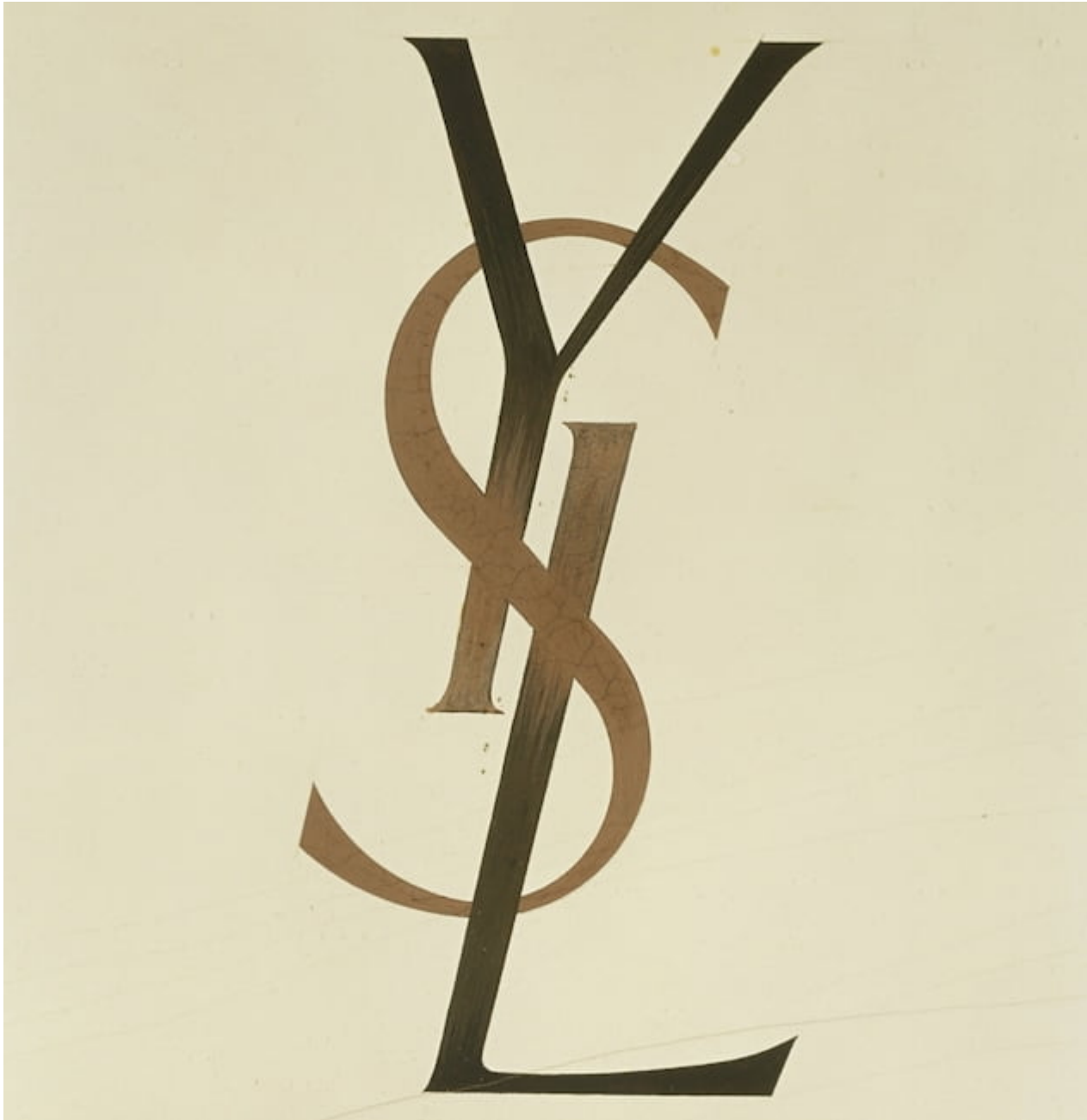
Entre sus últimos trabajos destaca el perdurable logotipo de Yves Saint Laurent

A partir de 1959 su éxito comienza a decaer con la llegada del Nuevo Realismo y el Pop Art y, después de varios proyectos poco reconocidos y diversos problemas personales que lo tenían sumido en la depresión, Cassandre toma la fatal decisión de acabar con su vida suicidándose en 1968.